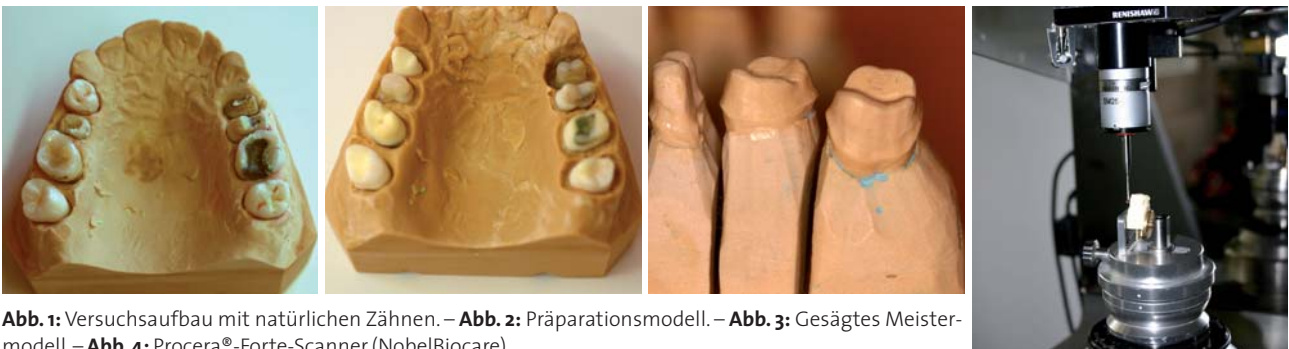
Abb. 1: Versuchsaufbau mit natürlichen Zähnen. – Abb. 2: Präparationsmodell. – Abb. 3: Gesägtes Meistermodell. – Abb. 4: Procera®-Forte-Scanner (NobelBiocare).

In der vorliegenden Studie wurden die Daten von sechs Procera®-Käppchen erfasst, bei denen je eine Vinyl-Poly-siloxan-Innenabformung (Abb. 5) durchgeführt wurde. Die fertiggestellten Innenabdrücke wurden fünfmal in